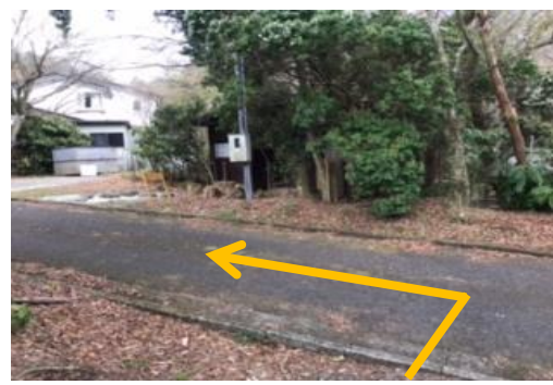
⑦ そのまま直進する。 ⑧ 草道が終わったら、舗装された道へ出る。その道を左折して真っ直ぐ進み、突き当りを道なりに右折。