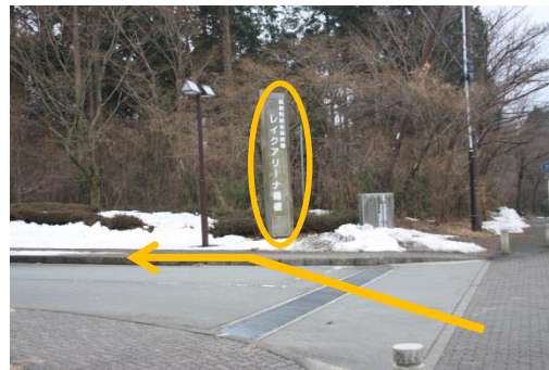
③ 左側に「レイクアリーナ」の看板が見える。敷地に入り、右側の歩道歩く。