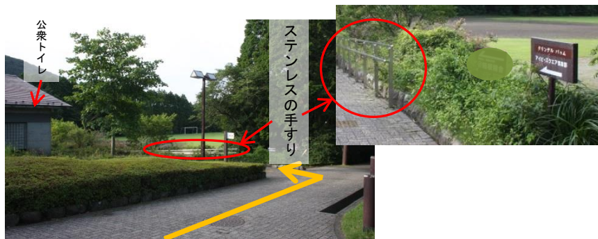
⑤ その先に、ステンレスの手すりが両脇にある小道がある。右側にグラウンド、左側に公衆トイレを見ながら直進する。