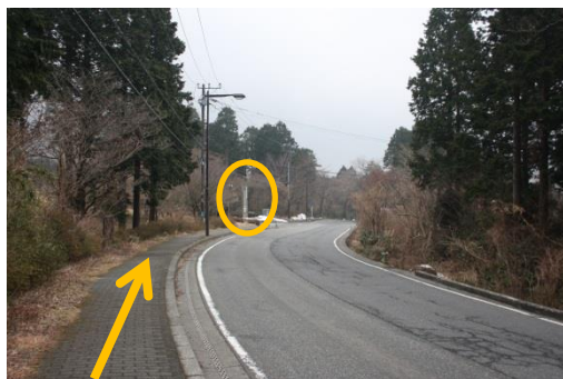
② 乗ってきたバスと同じ方向へ歩道を進む。