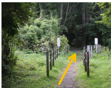
⑥ 建物を左手に見ながら直進し、石段7段を登ると草むらに入る。(ロープウェイの線路下をくぐる)