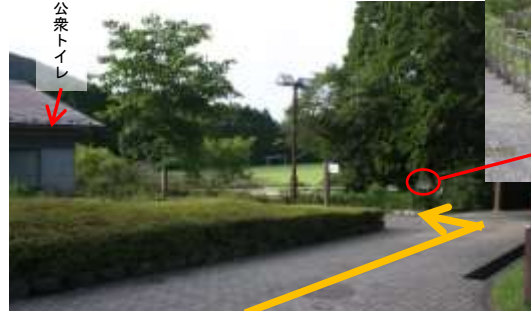
⑤その先に、小さな茶色い看板「クリンゲルバウム」が見える。 看板の矢印が指す方向へ、真っ直ぐ進む。