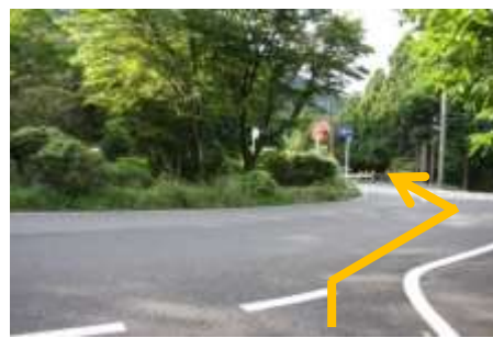
⑩広い道路を右へ進み、大きな坂を下る。 (※右側の狭い急な坂ではありません)