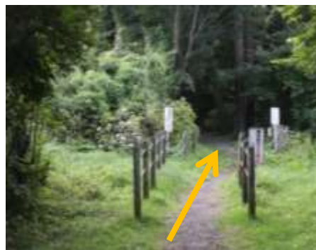
⑦そのまま直進する。 (ロープウェイの下をくぐる)