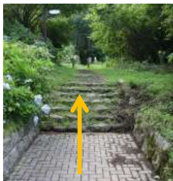
⑥建物を左手に見ながら直進し、 石段を登ると草むらに入る。