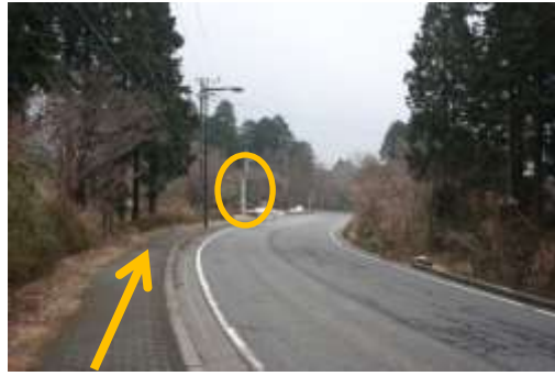
②乗ってきたバスと同じ方向へ そのまま歩道を進む。