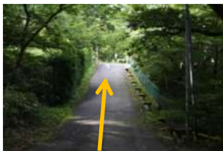
⑨そのまま直進すると、広い道路 に出る。