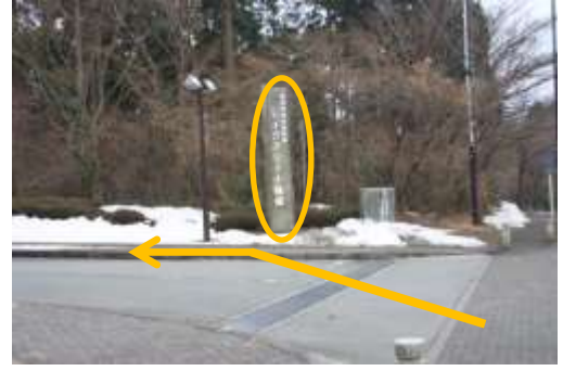
③左側に「レイクアリーナ」の看板が見える。 敷地に入り、右端の歩道を歩く。