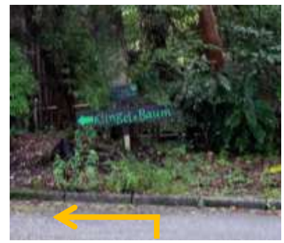
⑧草道が終わったら、舗装された道へ出る。 その道を左折して真っ直ぐ進み、 突き当りを道なりに右折。