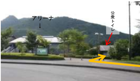
④アリーナの建物を正面にし、歩道を 右折すると、左手に公衆トイレが見える。